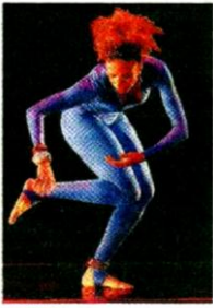
APLAUSOS SABOR HISPANO EN EL BALLET DE ALVIN AILEY PÁG. 8